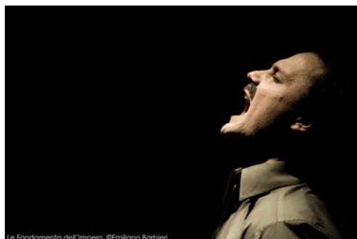
Le Fondamenta dell'Impero