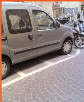
Napoli zone riservate