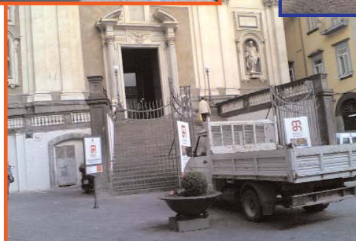
Mantova Centro Antico