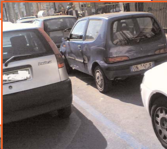
Napoli Centro Antico